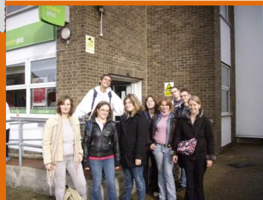
Action : Mobilité européenne

1 jeune sur 3 possède son propre moyen de locomotion motorisé (automobile, moto, scooter)